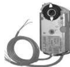
Luftventil für Motor (ST1-6)