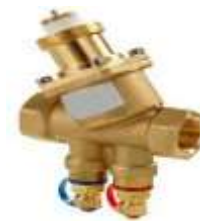
H2O Ventil (SV1)