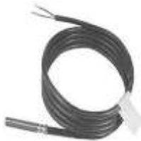
Kanal-Temperatursensor (GT5), H2O Vorlauftemperatursensor (GT3), H2O Rücklauftemperatursensor (GT4)