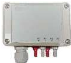
Kanal-Drucksensor (GP2), Filter-Drucksensor (GP1)